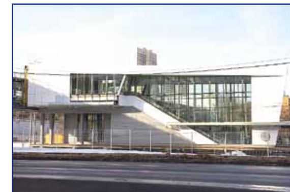
Москва, пешеходные мосты на ТПУ МЦК Московской ж. д.