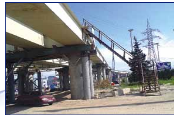
Ростов-на-Дону, левобережная эстакада моста через реку Дон